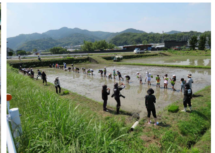
【合同田植えの様子】