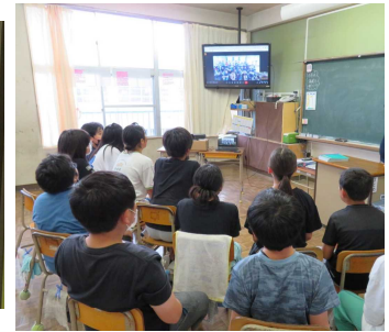
【オンライン学習の様子】

お互いの良さや人気ベスト3などを紹介する場面が見られました。昨年度に続き、とても良好な雰囲気の交流でした。