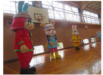
【消防音楽隊とキャラクター参加の様子から】