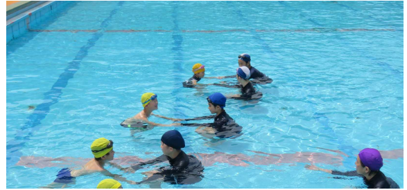
【1年生と6年生のプール開きの様子から】

6月12日(月)にプール開きを行い、各学年の指導内容に応じた浮く力、泳ぐ力の学習をがんばっています。指導時間は、約8時間で各学年が目標とする泳力を高めています。今年は、水泳指導員の先生方をゲストティーチャーにお招きして指導しています。命を水から守る学習も行います。